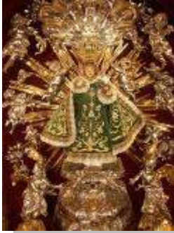
L'enfant Jésus de Prague